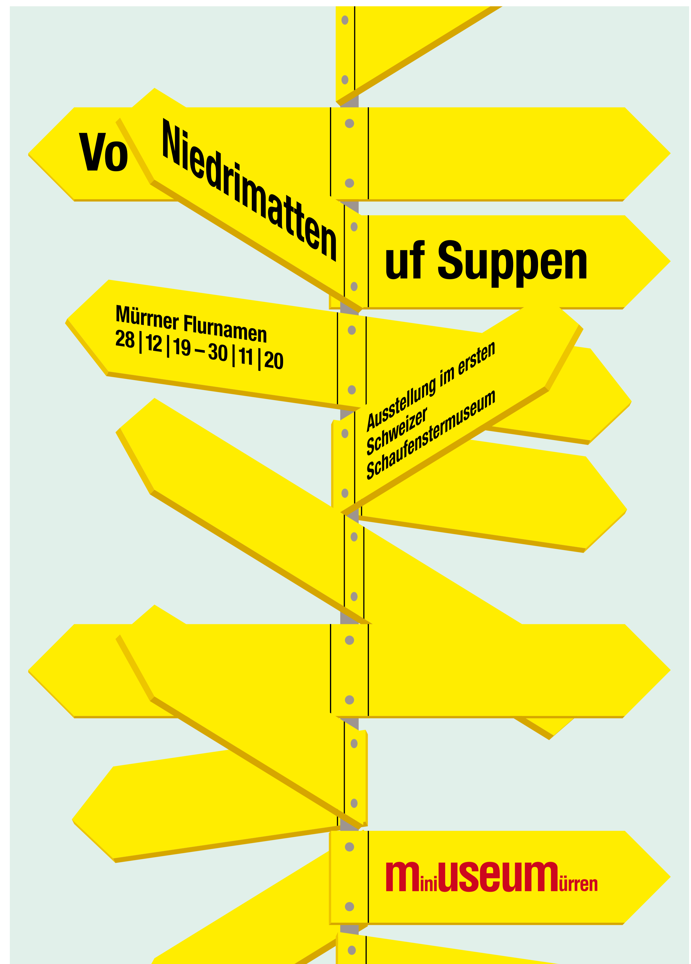
Kartensujet zur diesjährigen Ausstellung