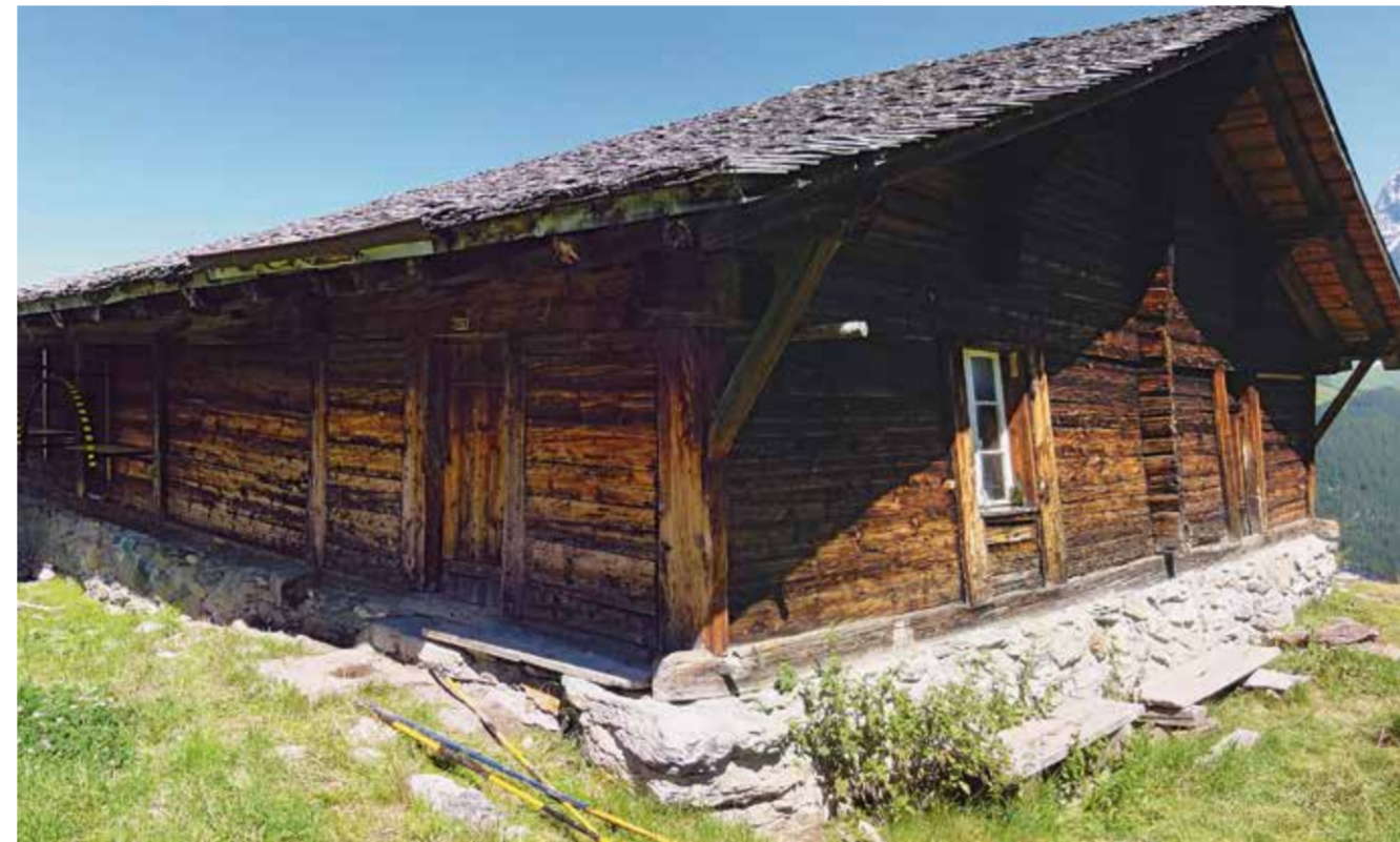
Innere Mittelberghütte, 1870

Ergänzende Texte finden Sie in der Broschüre.