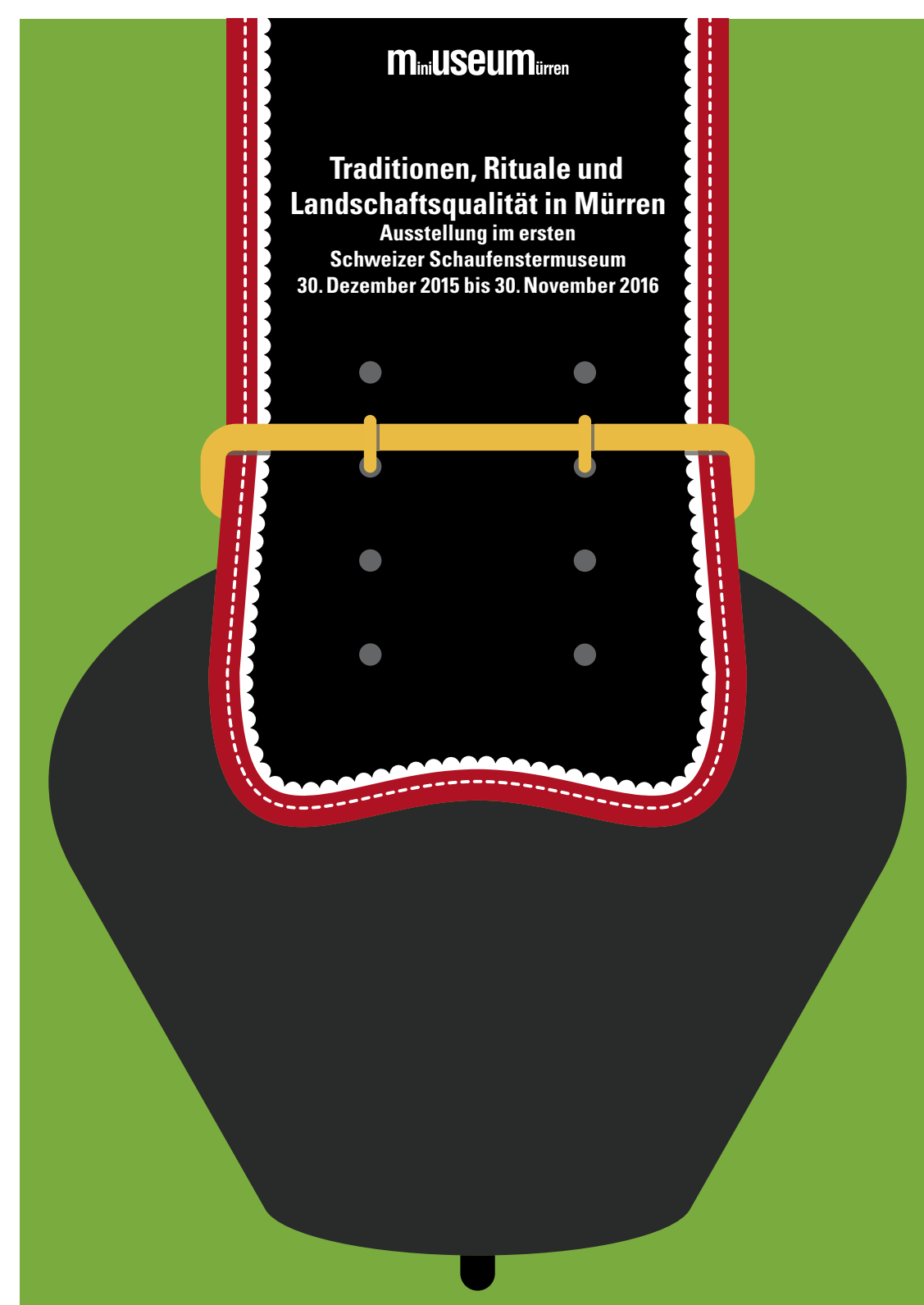
Kartensujet zur diesjährigen Ausstellung