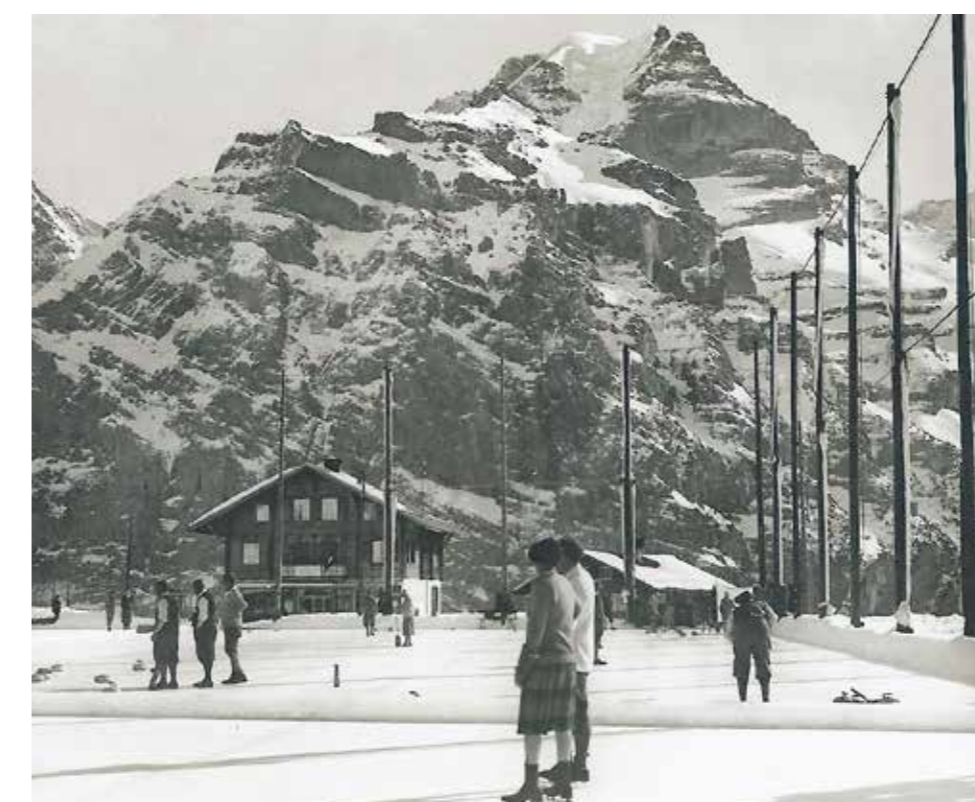
Die grosse Natureisbahn lud zum Aufenthalt ein