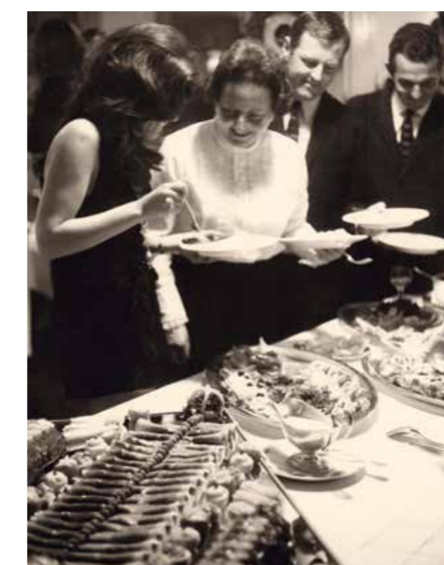
Hotel Eiger, Essen der Bond-Riege