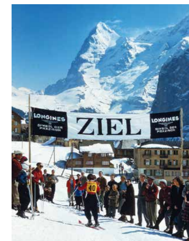
Skifahren in Mürren 1962