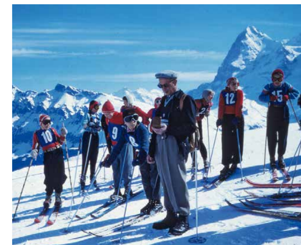
Skifahren in Mürren 1962