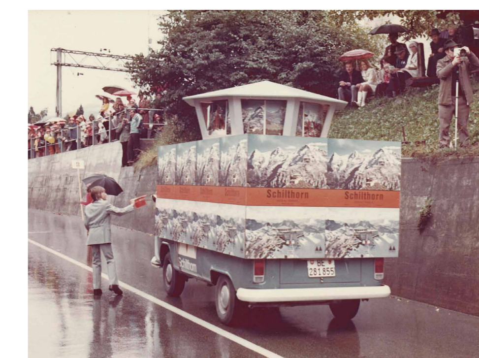
Bus mit Schilthorn