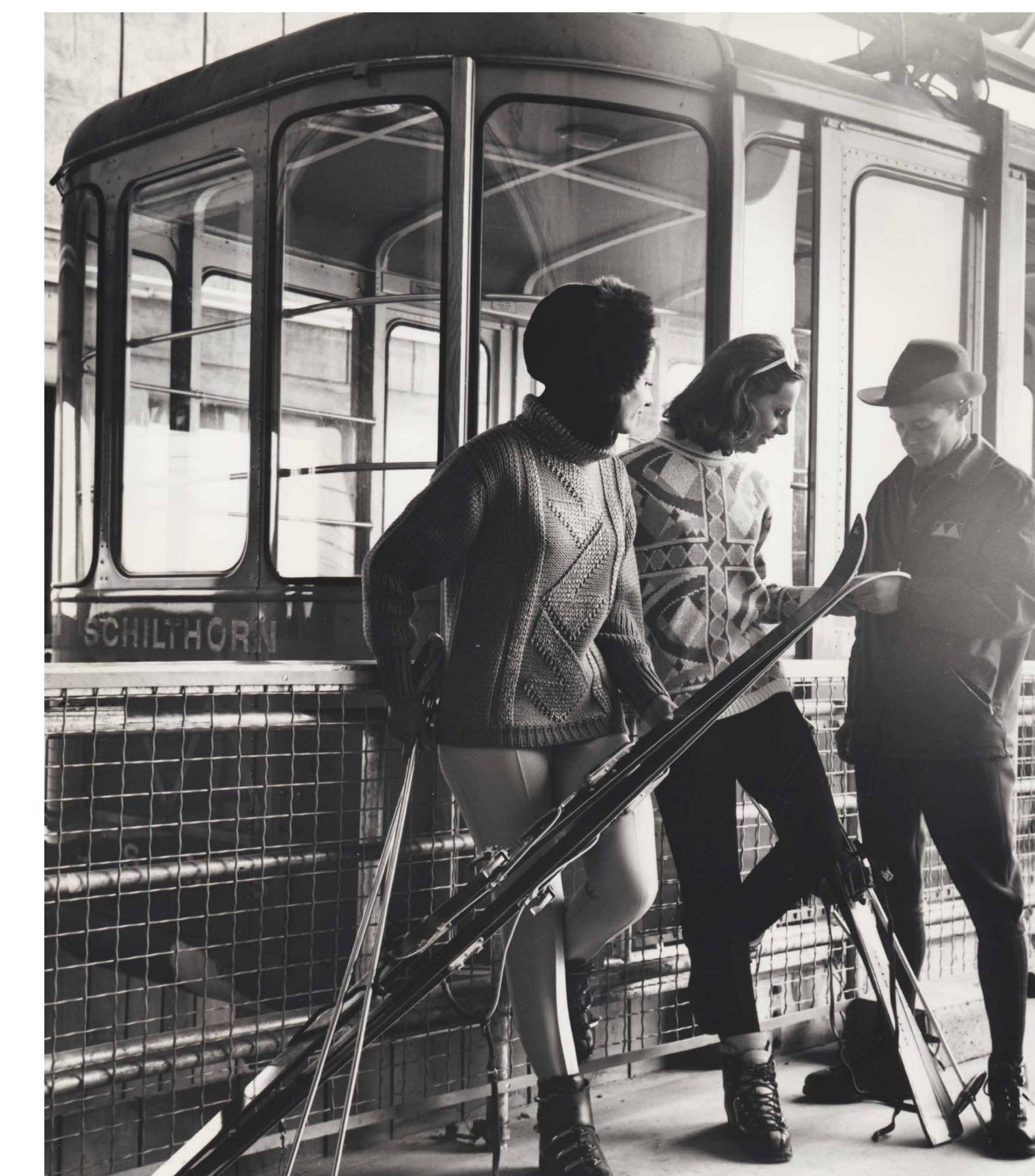
Modelfoto mit Schilthornbahn-Angestellten