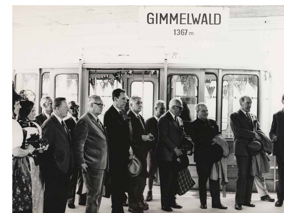
Bundesrat auf Ausflug auf dem Schilthorn, 29.06.1971