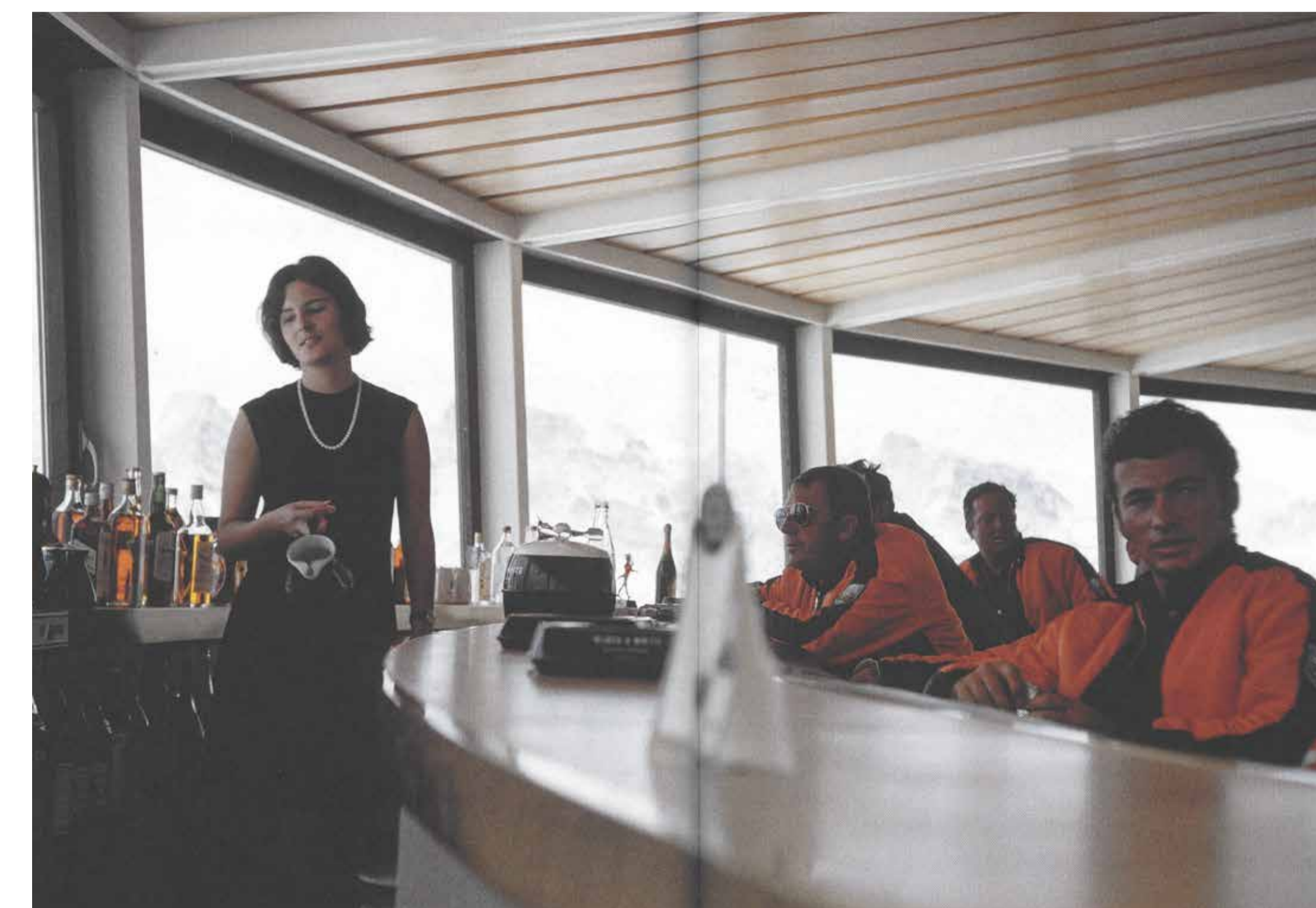
Schilthorn – Bar für Bondfilm, Aus: James Bond und die Schweiz, im Besitz von Rolf Heimlinger