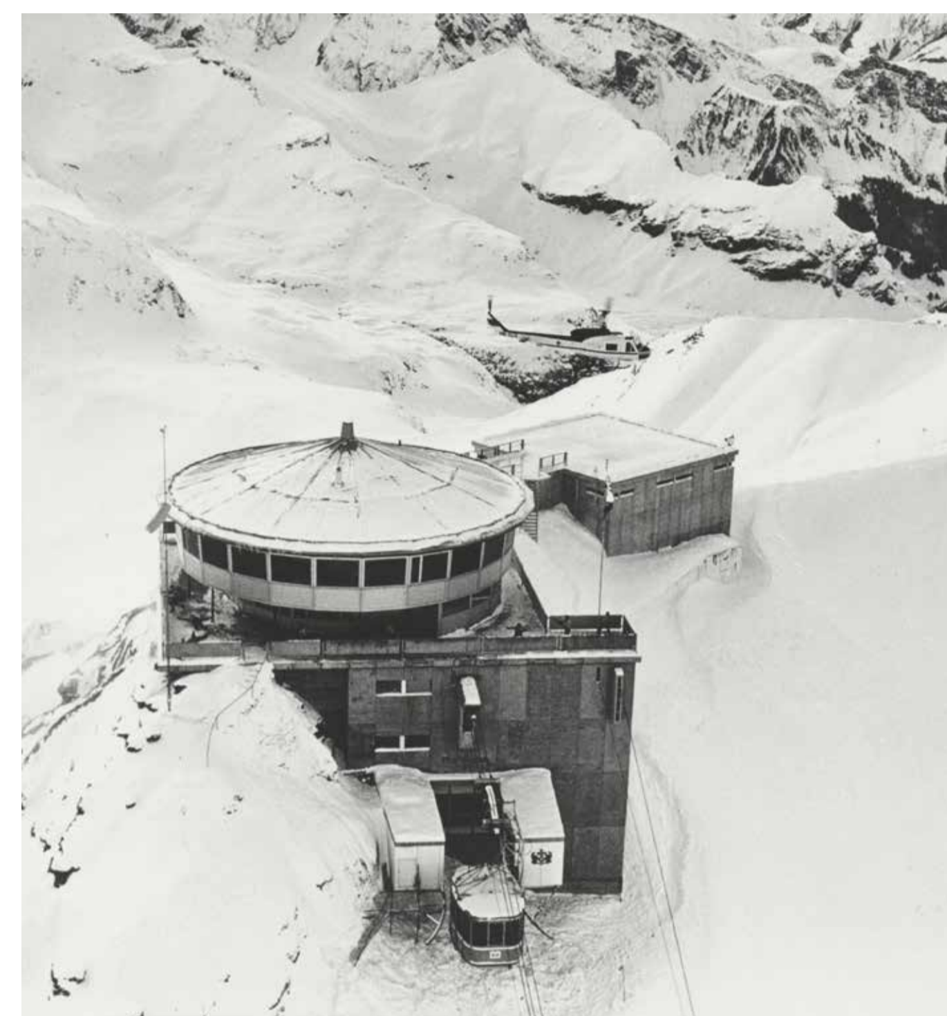
Helikopter-Plattform für Bondfilm gebaut