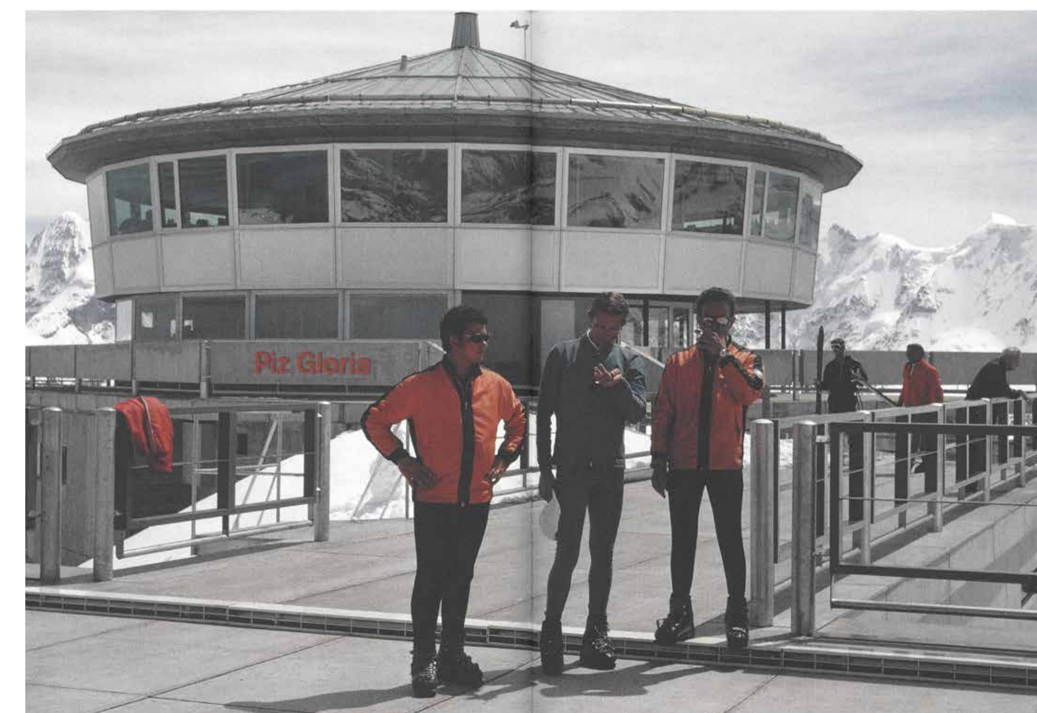
Schilthorn mit Bondstatisten