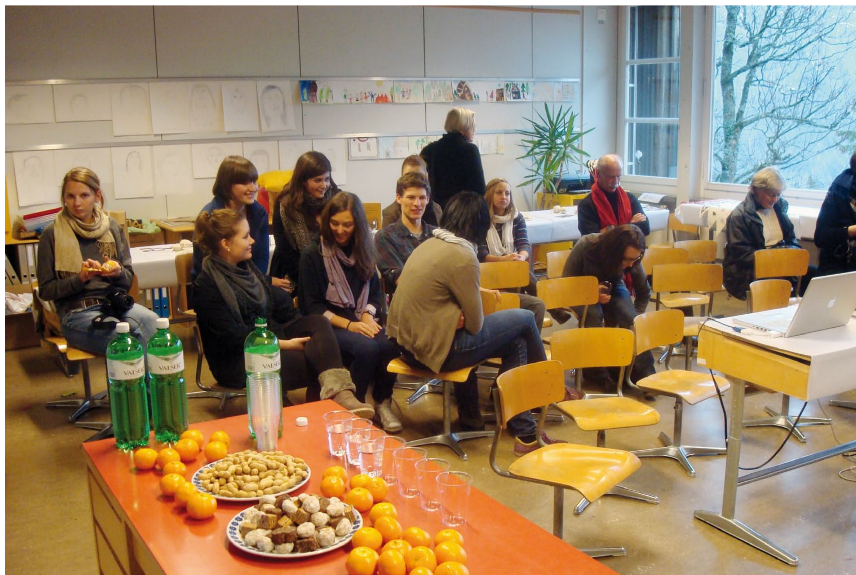
Vorbereitung der Schlusspräsentation in Mürren