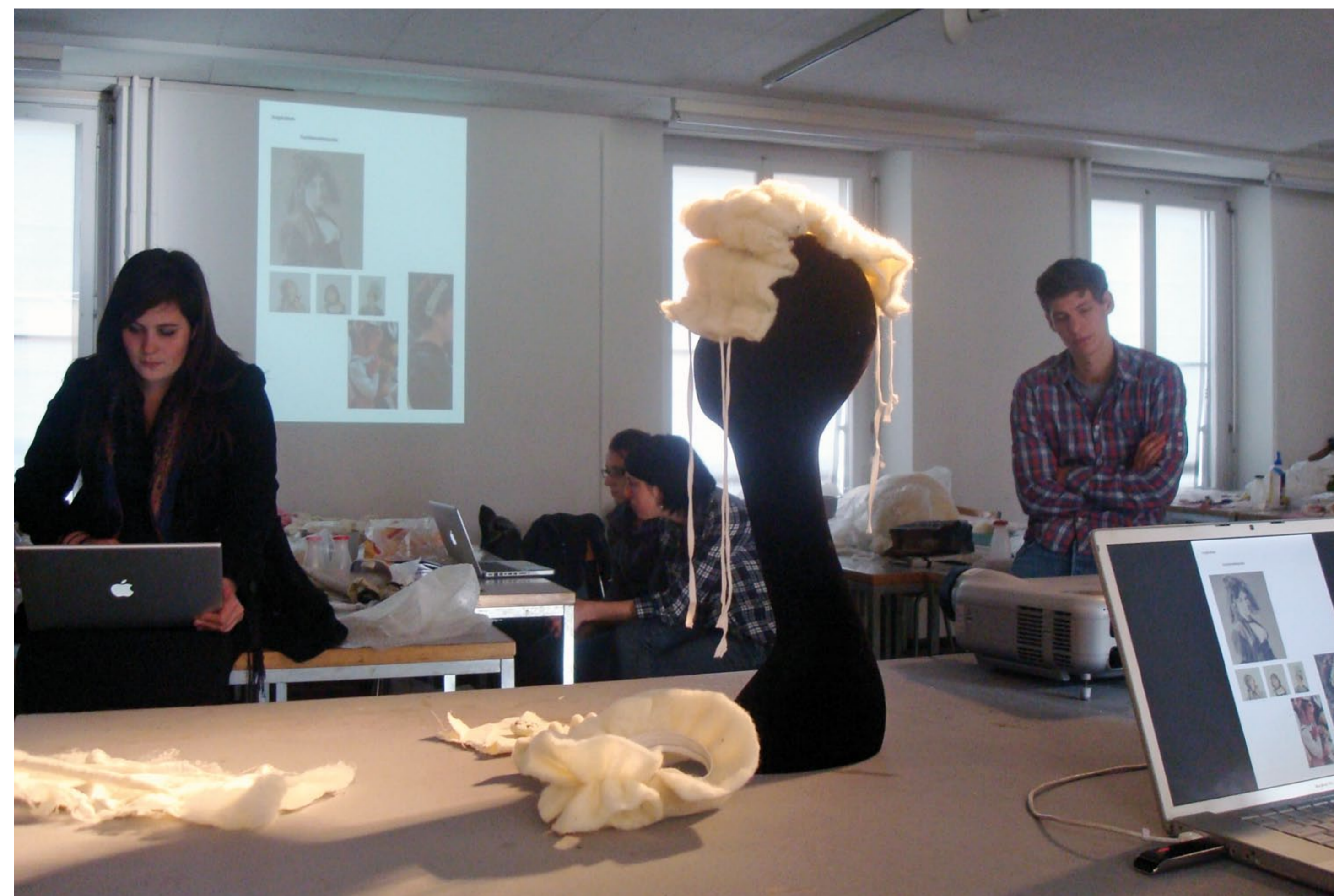
Zwischenpräsentation an der ZHdK