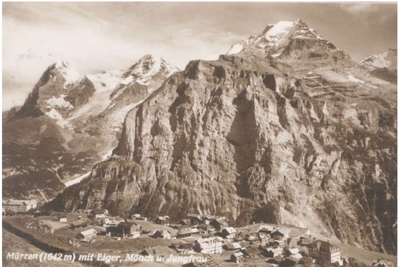
Mürren ca. 1920